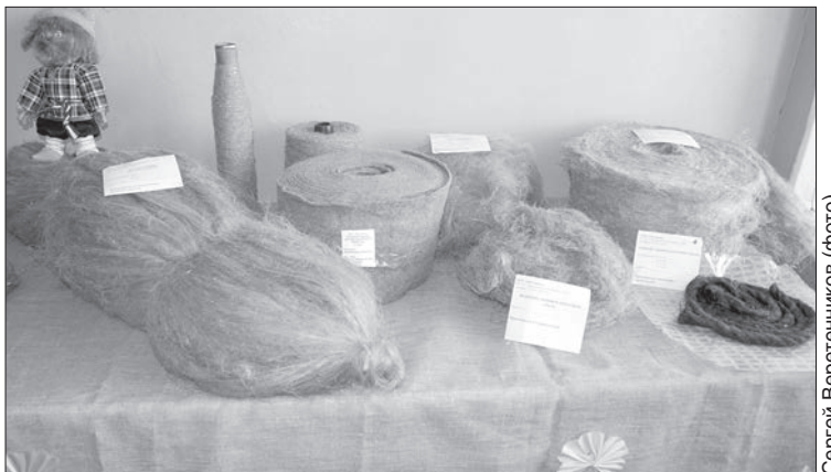
Сергей Веретенников (фото)